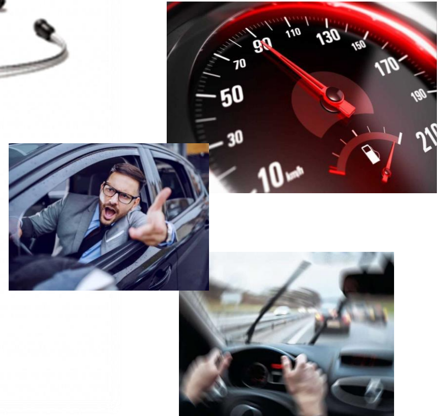
Capacité & Comportements