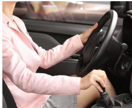
Aptitude & Qualifications